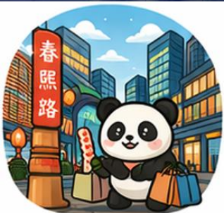
ถนนคนเดินชุนซีลู่ (Chunxi Road)

จากนั้นอิสระท่าน ถนนคนเดินชุนซีลู่ ย่านช้อปปิ้งชื่อดังและคึกคักที่สุดของเฉิงตู เต็มไปด้วยห้างสรรพสินค้า ร้านแบรนด์ดัง ร้านอาหาร และสตรีทฟู้ด เหมาะสำหรับช้อปปิ้งและสัมผัสวิถีชีวิตคนเมือง และ ถนนคนเดินไท่กู่หลี่ แหล่งช้อปปิ้งไลฟ์สไตล์สุดทันสมัย ผสมผสานสถาปัตยกรรมจีนโบราณกับดีไซน์โมเดิร์นอย่างลงตัว รายล้อมด้วยร้านค้าแบรนด์ดัง คาเฟ่ และมุมถ่ายรูปสวยๆ มากมาย